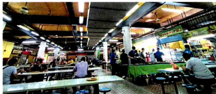
City council food courts will be well patronised if they are upgraded and maintained well.

Residents want to see planned expenditure, improved amenities