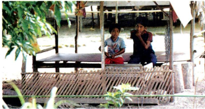
The indigenous people hope the govt will not continue with degazetting the forest for development

"The PKR Political Bureau has stressed that decisions need to adhere to a number of basic principles including the importance of