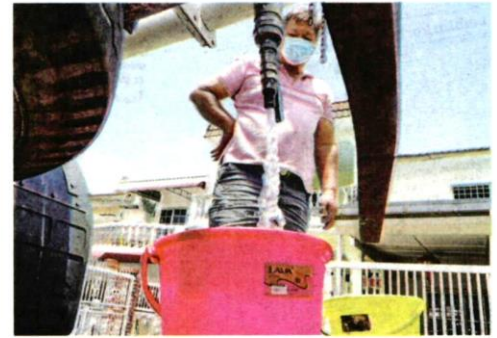
SEORANG penduduk menadah air yang dibekalkan oleh lori Air Selangor di Seri Kembangan kelmarin.

Kosmo! sebelum ini melaporkan hampir sejuta penduduk di lima wilayah terabit mengalami gangguan bekalan air tidak berjadual berpunca daripada pencemaran bau yang dikesan berlaku di Stesen Pam Air Mentah Jenderam Hilir kira-kira pukul 11.10 pagi, Selasa lalu.