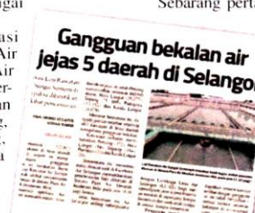
Laporan Sinar Harian pada 1 September mengenai gangguan bekalan air di lima daerah di Selangor.

Pada Rabu, Air Selangor menjangkakan gangguan bekalan air di semua 463 kawasan terjejas di Lembah Klang dijangka pulih sepenuhnya pada Khamis.