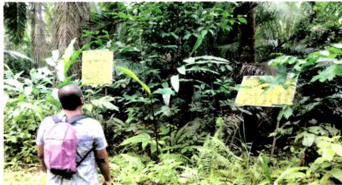
HUTAN Simpan Kuala Langat Utara yang menyimpan pelbagai khazanah flora dan fauna berharga kini termasuk dalam pelan kerajaan negeri untuk dimajukan dengan projek komersial.

"Ia membabitkan Hutan Simpan Sungai Panjang (308.62 hektar), Hutan Simpan Buloh Telor Barat (149.96 hektar), Hutan Simpan Buloh Telor Timur (57.18 hektar) dan Hutan Simpan Broga (63.88 hektar) sebagai Hutan Simpanan